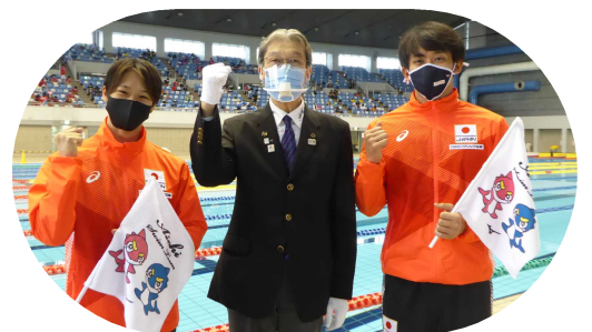
(一社)愛知水泳連盟箕輪田会長(中央)に活躍を約束する両代表選手