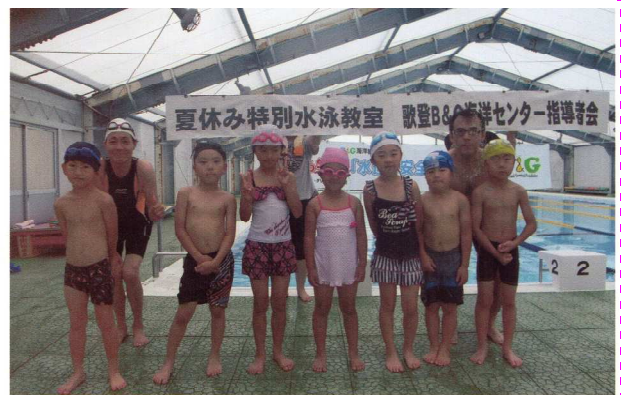
〈三角のテント屋根での水泳教室〉

ステキなお話をありがとうございました。遠い、遠い北の果てまでお疲れさまでした。ご自分が取得された資格を、「郷里の子供たちに水泳を教える」ことで生かし、町の活性・発展に協力されることに感動しました。